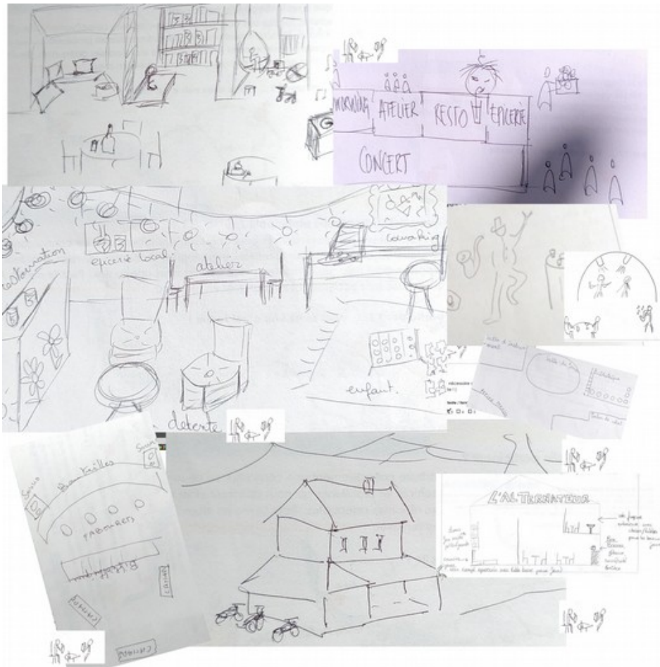
L'Alternateur – un lieu qui nous ressemble Compilation des dessins issus du diagnostic participatif

Le café associatif est basé sur la co-construction et la participation de ses usagers.