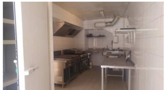
Cuisine professionnelle équipée et aux normes