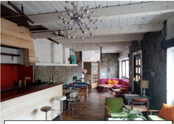
Espace restauration, lecture, jeux, dégustation, travail.